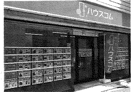
この仕組みは、オンラインチャットで▶ハウスコム大森店

7月にオーナーと入居者向けに提供を始めたサービス「ハウスコムスマートシステム」の中で、オーナーは無料で弁護士や司法書士にチャットで相談できる。システム内でマッチングした判定人から判定を受ける。オーナーや入居者は、個別に判定実施契約を有償で締結する必要がある。