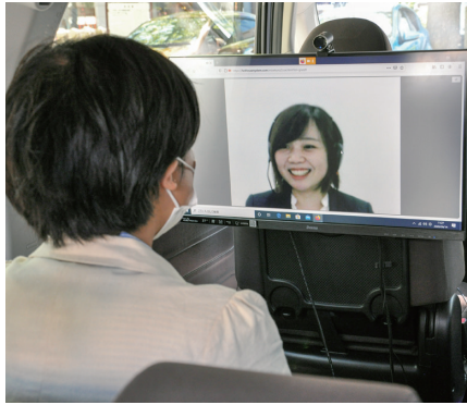
▲車内のモニター越しにスタッフの説明を聞く来店客