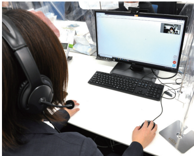
▲VR内覧、IT重説など非対面での接客に対応